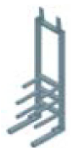
MONTÁŽNÍ RÁM pro topnou větev školy